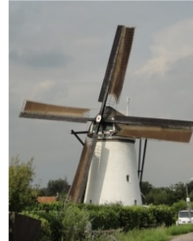
Kooijwijkse Molen in Oud-Alblas

In Zuid-Holland bestaat geen provinciale molenorganisatie omdat de provincie een centrale rol speelde in het molenbehoud. Nu er sprake is van terugtreden in het adviseren en ondersteunen van moleneigenaren, wordt op 14 september in de middag een bijeenkomst georganiseerd door De Hollandsche Molen, teneinde te inventariseren of er behoefte is aan een belangenorganisatie in Zuid-Holland en hoe deze er eventueel uit zou moeten zien. Een selectie van moleneigenaren in deze provincie wordt binnenkort uitgenodigd voor deze netwerkbijeenkomst.